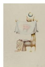
Jules Perahim L'alphabet. 1974. 1/25 Japon.