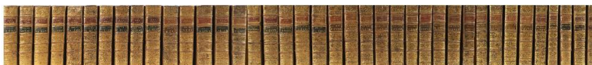
Diderot d'Alembert. En cyclopédie... Pellet. 1777-1779. 39 vol. In-4