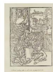
Saint Jérôme Liber epistolarum. Bois de Dürer. 1513.