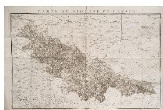
Bourgoin. 24 cartes des diocèses du Languedoc.