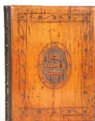
New Zealand Ferns 31 planches de fougères.